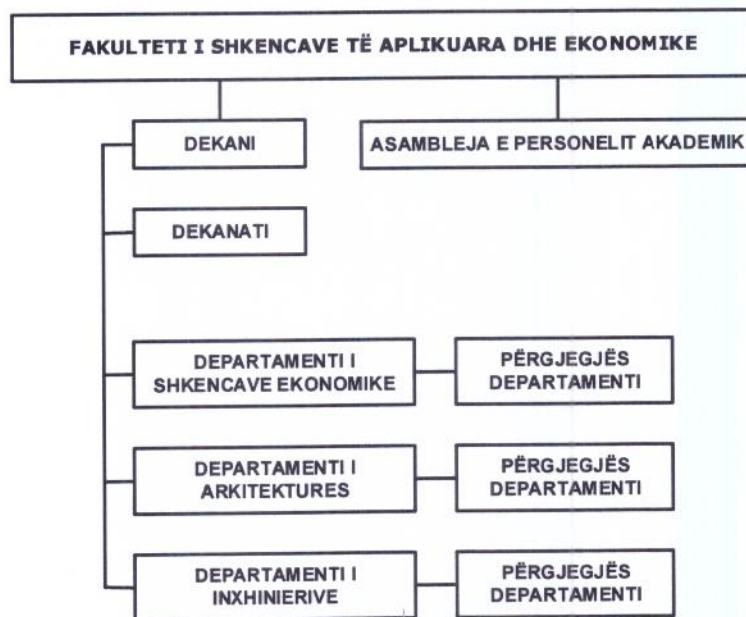
Organigrama e Fakultetit të Shkencave të Aplikuara dhe Ekonomike

Fakulteti i Shkencave të Aplikuara dhe Ekonomike përbëhet nga tre Departamente sipas skemës organizative në vijim [Evidencë L2-32, neni 14, Evidencë L1-31, faqe 3]: